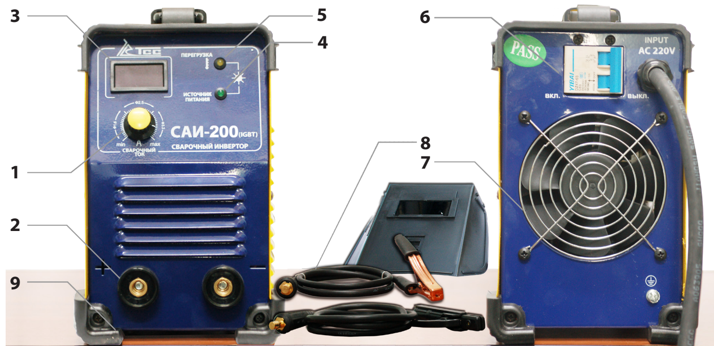
1 - регулировка сварочного тока; 2 - выводы для подключения кабеля; 3 - цифровой дисплей; 4 - индикатор сети; 5 - индикатор перегрузки; 6 - автомат защиты сети; 7 - вентилятор; 8 - кабель; 9 - прорезиненные углы.